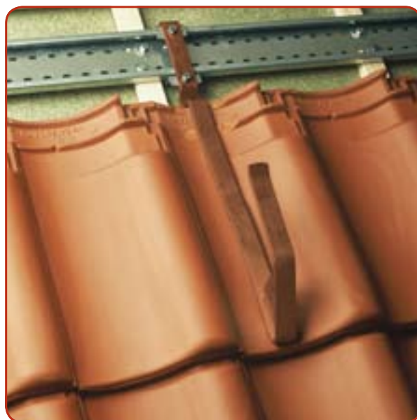
MultiValRichting veiligheidssysteem op keramische dakpannen