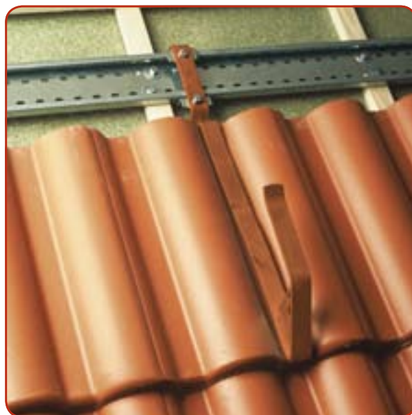
MultiValRichting veiligheidssysteem op betondakpannen

De afdeling Dakservice van MONIER kan u adviseren inzake het aanbrengen van veiligheidsvoorzieningen op hellende daken.