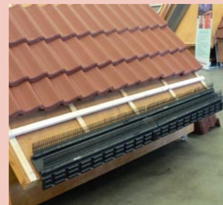
Dakvoet met de Monier Vogelvide