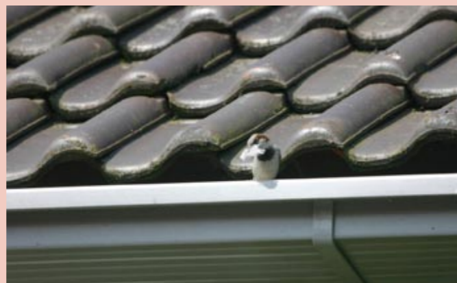
Dak met de Monier Vogelvide