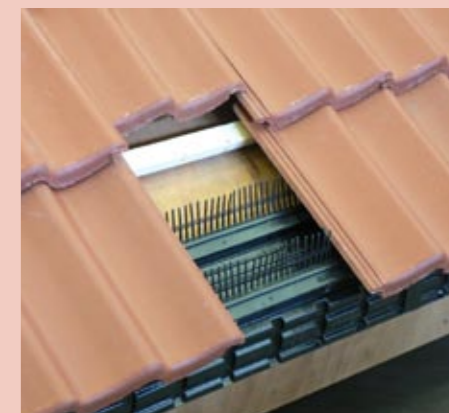
Dakvoet, Monier Vogelvide en pannendek