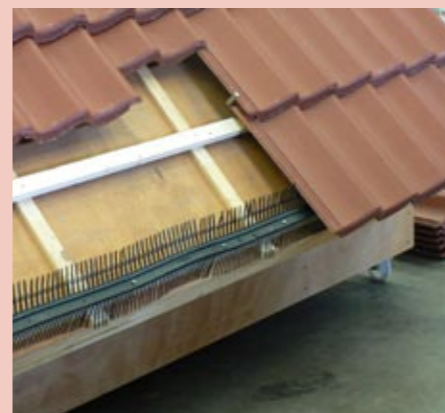
traditioneel dak met vogelschroot