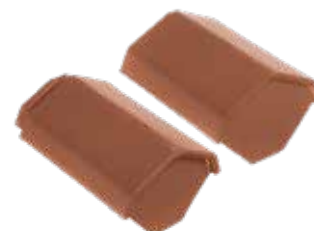
HV begin- / eindvorst type K