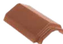
HV vorst type K