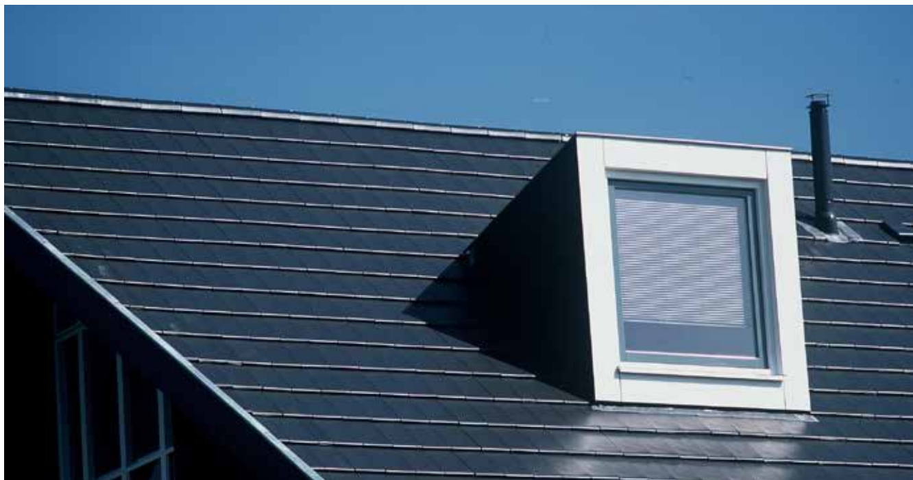
zwart vol donker engobe