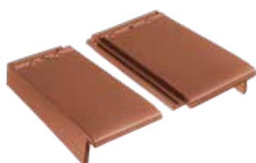
gevelpan links en rechts