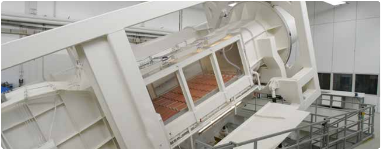
Bij Monier testen we onze dakpannen uitgebreid, onder andere in de wind- en regentunnel.