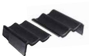
Gevelpan links en rechts