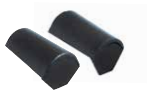
Uni-begin- / eindvorst