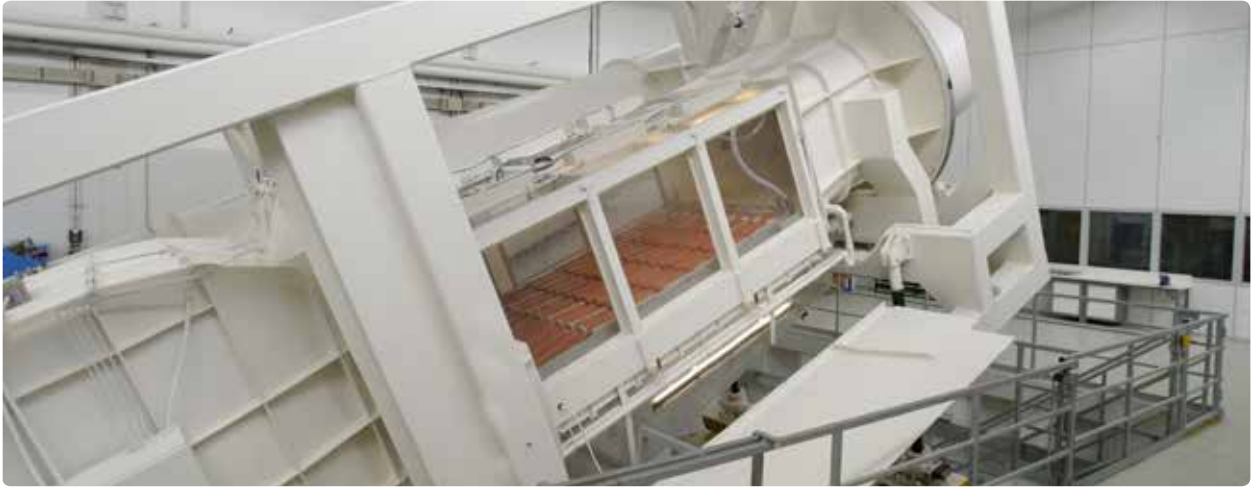
Bij Monier testen we onze dakpannen uitgebreid, onder andere in de wind- en regentunnel.