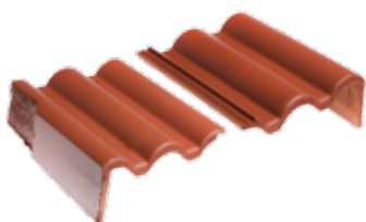
Gevelpan links en rechts