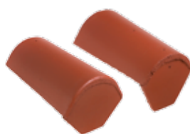
Uni-begin- / eindvorst