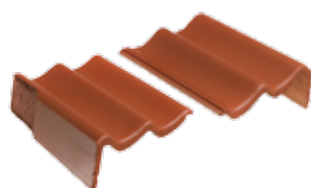
Gevelpan links en rechts