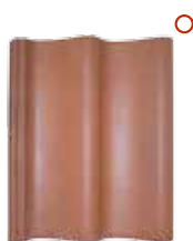
nieuw rustiek nuance