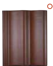
herfstkleur TWP nuance