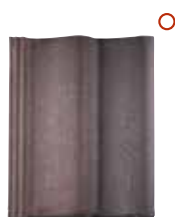
herfstkleur RBB nuance