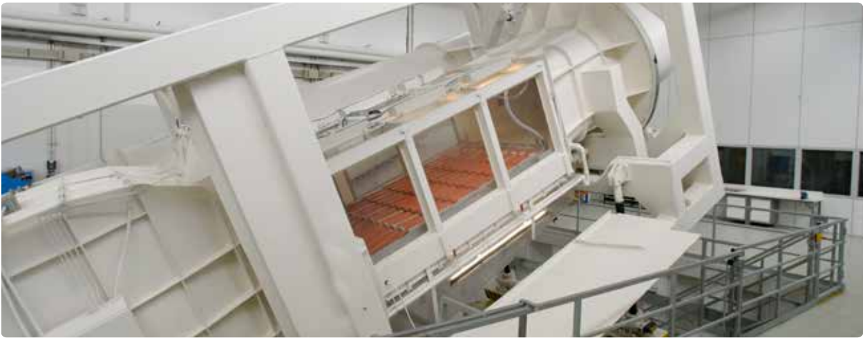
Bij Monier testen we onze dakpannen uitgebreid, onder andere in de wind- en regentunnel.