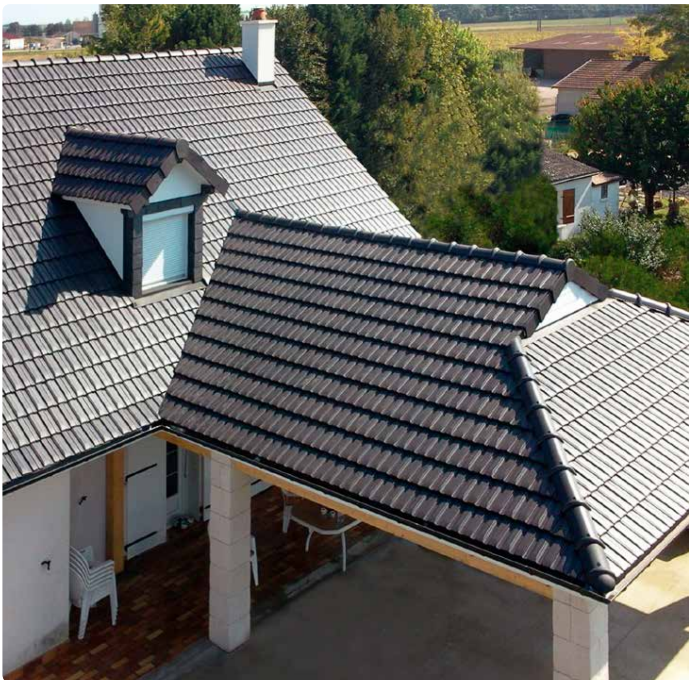
Antraciet mat vol donker engobe