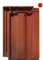
rood rustiek engobe