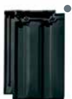
antraciet mat vol donker engobe