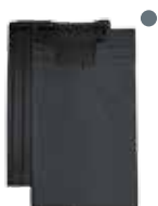
antraciet vol donker engobe