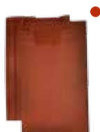
rood rustiek engobe