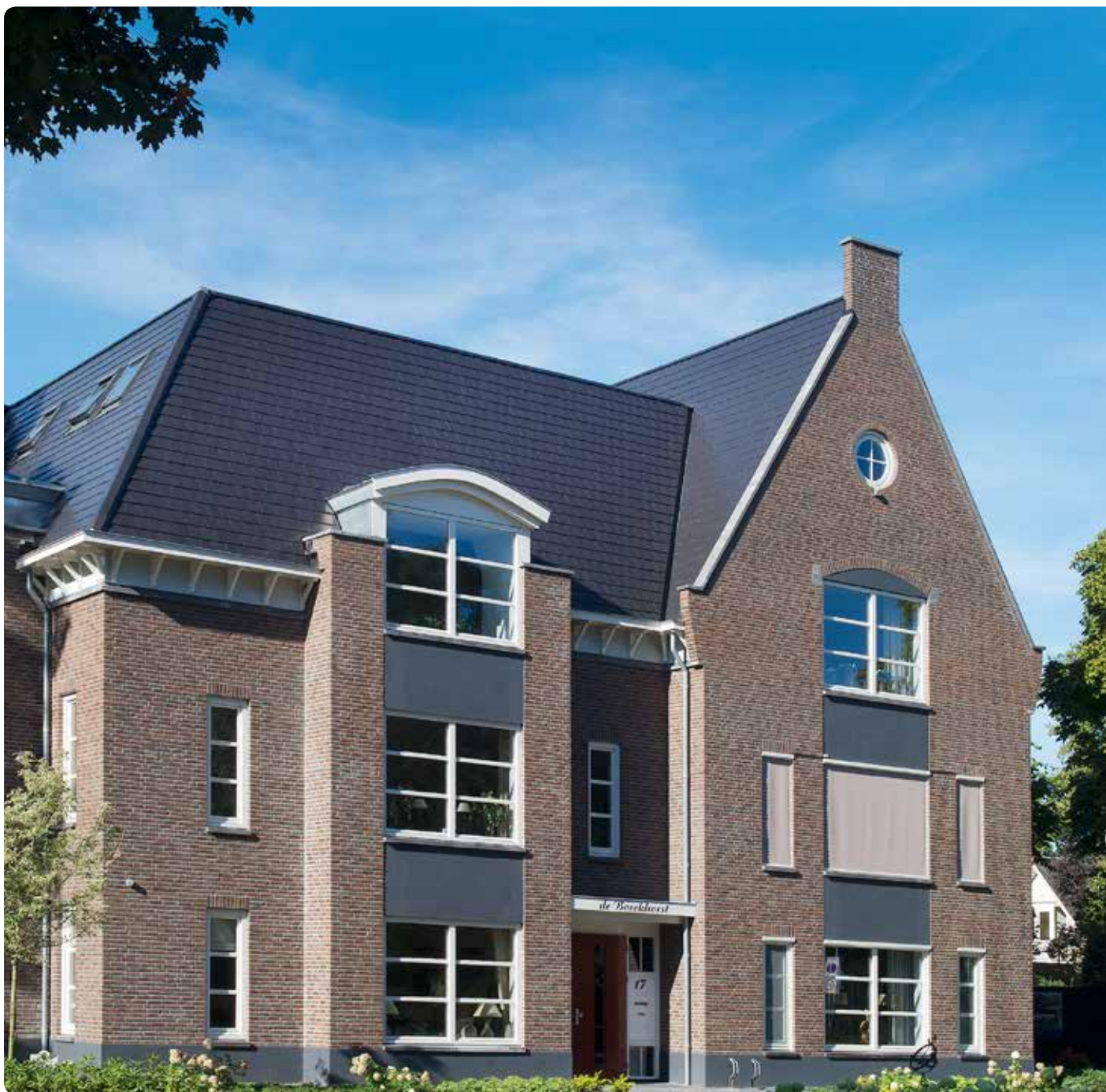
Antraciet vol donker engobe