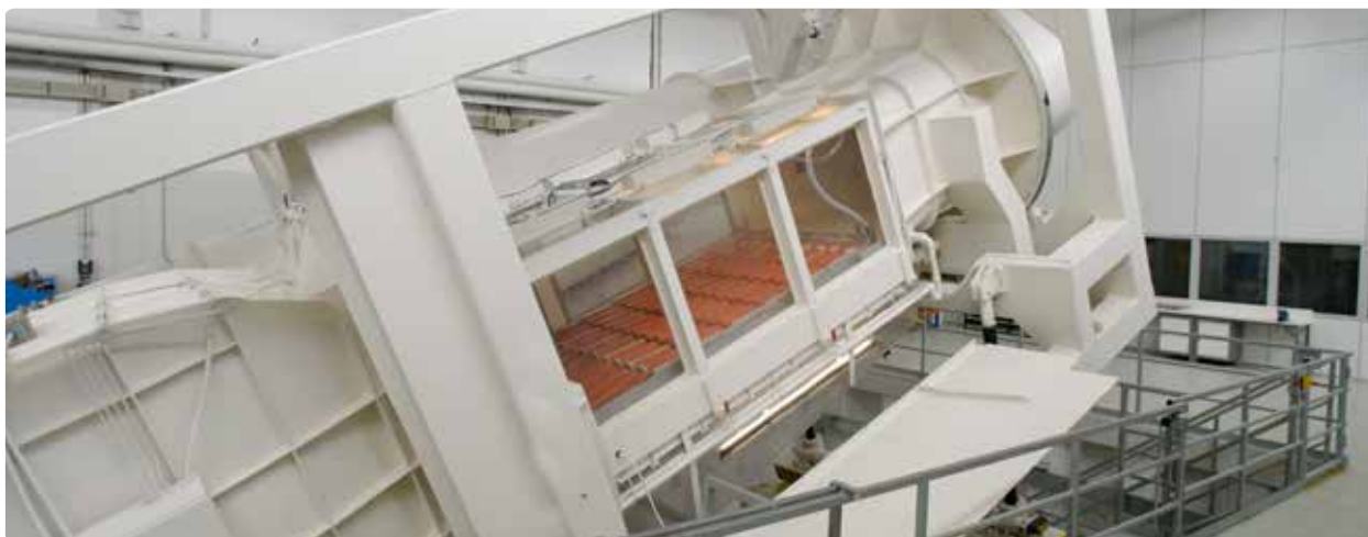
Bij Monier testen we onze dakpannen uitgebreid, onder andere in de wind- en regentunnel.