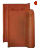
rood rustiek engobe