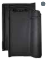
antraciet vol donker engobe