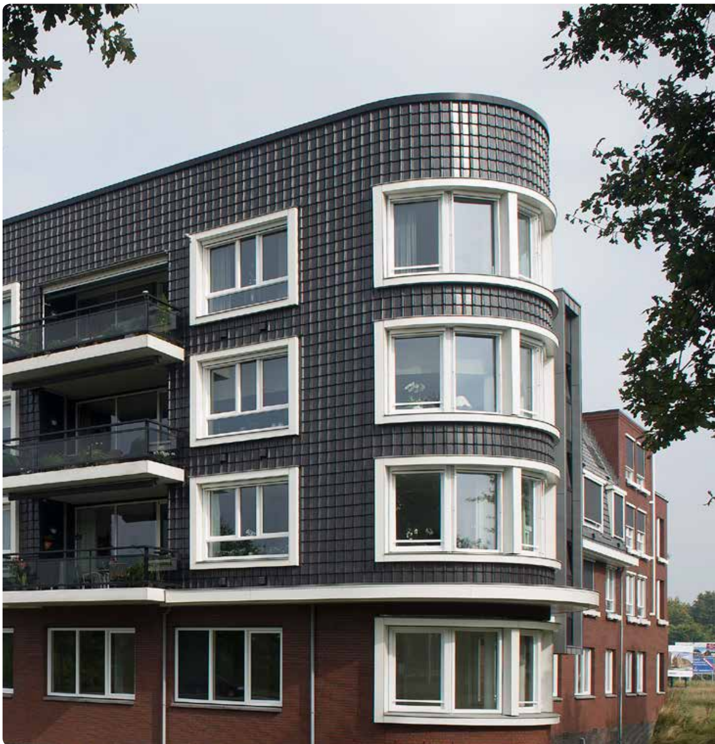
Antraciet vol donker engobe