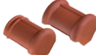
Halfronde beginvorst en eindvorst*