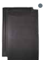
antraciet mat vol donker engobe