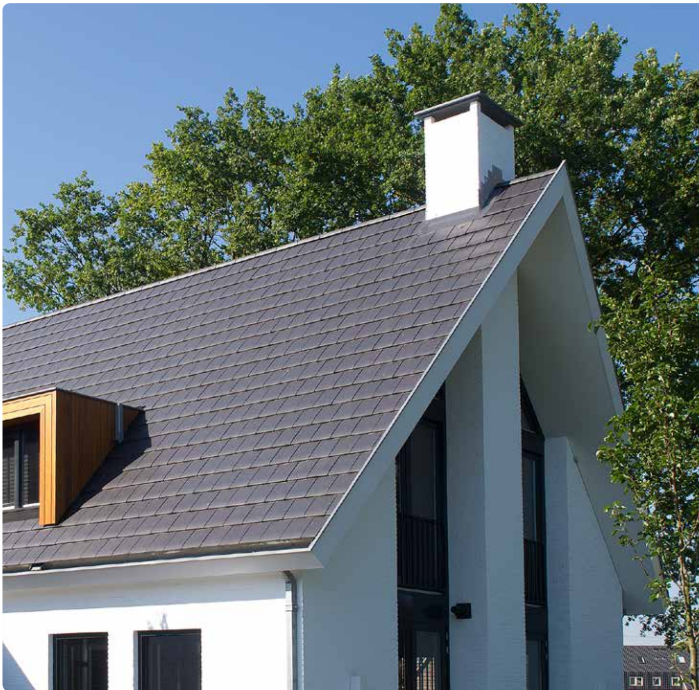
Antraciet mat vol donker engobe