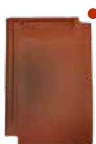
rood rustiek engobe