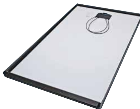
InDaX Module achterzijde