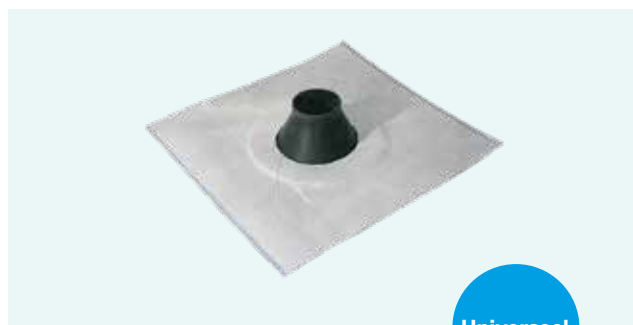
Doorvoer manchette zelfklevend.

De opstand is hoog genoeg om eventueel langskomend vocht te keren. De diameter van 50-70 mm is voldoende voor de doorvoer van kabels en (geïsoleerde) zonnethermische leidingen.