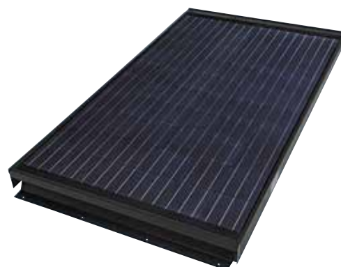
PV InDaX Module

Download de volledige productspecificatie op www.monier.nl